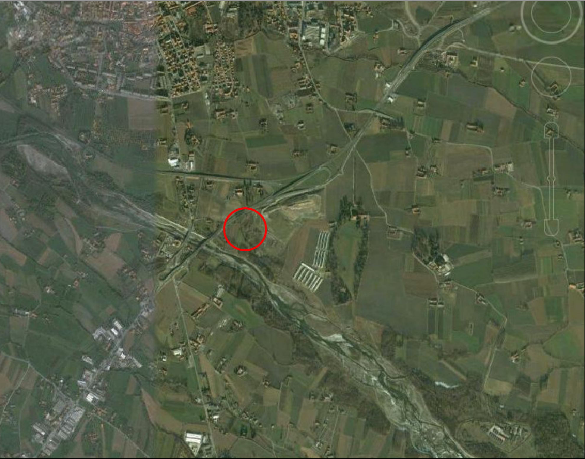
ESTRATTO ORTOFOTOCARTA-Fuori scala